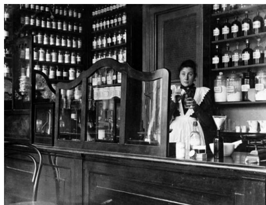
Deze foto van een apotheek komt uit 1893.

Hippocrates (als je het uitspreekt moet je het accent op de 'o' leggen: Hippócrates) is zo beroemd geworden, omdat hij bedacht dat alle genezers een eed moesten afleggen. En daarin verklaarden ze dat ze alles zouden doen om de zieken weer beter te maken. Ook de dokters van tegenwoordig leggen nog steeds zo'n eed af.