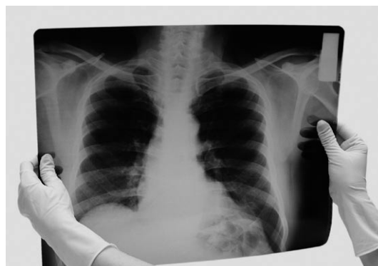
Op een röntgenfoto kan een dokter in je lichaam kijken.

Een andere belangrijke ontdekking werd in 1928 gedaan door de Brit Alexander Flemming. Penicilline heette die ontdekking, een schimmel die bacteriën kan doden. Tegenwoordig noemen we alle geneesmiddelen die bacteriën doden antibiotica. Misschien heb je het wel eens gehad? "Kuurtje afmaken hoor!", zegt de dokter dan altijd. Penicilline werd vooral tijdens de Tweede Wereldoorlog een belangrijk middel. Gewonde soldaten kregen toen vaak ernstige infecties. De penicilline doodde de bacteriën, waardoor de soldaat bleef leven.