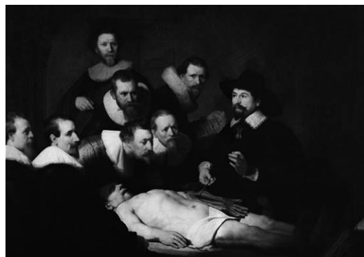
De anatomische les van dr. Nicolaes Tulp geschilderd door Rembrandt van Rijn

Omdat er aan die wonderlijke machine wel eens wat stuk gaat, zijn er altijd mensen geweest die geprobeerd hebben er achter te komen hoe ons lichaam precies werkt. Want als je dat weet, kan je repareren wat kapot is. Of beter gezegd: genezen wat ziek is. Daarom werden dode mensen soms opengesneden om te kijken hoe het lichaam in elkaar zit. Het heeft duizenden jaren geduurd voor ze er echt iets van begonnen te begrijpen.